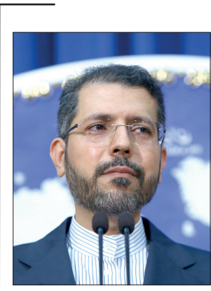
وب گاه امروز: WWW.TODAYONLINE.IR

سخنگوی دستگاه دیپلماسی بسته نشدن پرونده ادعاهای سیاسی آژانس بین المللی انرژی اتمی (IAEA) علیه کشورمان را ضروری دانست و تأکید کرد ایران هیچ ضرب الاجلی را قبول نمی کند. سعید خطیب زاده گفته: ما درباره پرسش ها با ادعاهای سیاسی که آژانس در خصوص برخی اقدامات کشورمان مطرح کرده که از نظر ما محلی نداشته است پاسخ دادیم؛ این پرونده باید بسته شود و افزودن پرونده به تعمیری نباید مجری برای فشارهای سیاسی آژانس علیه کشورمان باز نگه داشته و کسی این اشتباه را مرتکب شود که از آن بترسد فشاری بر ما وارد کند.