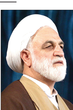
وب‌گاه امروز: WWW.TODAYONLINE.IR