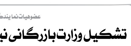
عضو هیات نما یندگان اتاق بازرگانی تهران؛

وی با بیان اینکه جهان در حال تغییر است، اظهار کرد: ما به عنوان ایران و جمهوری اسلامی هم می‌توانیم و هم موفقیم جایگاه خود را به دست آوریم، نظام بین الملل نظامی مبتنی بر