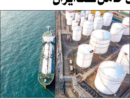
کشتی به کشتی نفت اورال روسیه در قیاسو اسل انجام می‌شود که به عنوان «لاریک شن» معروف شده است. هدف این است که بازرگاری با تجربه

محمولها شناسایی نشود. پنج مورد از ۱۴ فروند VLCC و افرامکس که در هفته‌های اخیر در این محدوده خاموش شده‌اند، قبلاً تحت خام ایران را برجامی کردند.