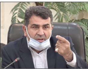
عضو ناظر مجلس در شورای عالی حقوق،

میزان افزایش حقوق در لایحه متناسب سازی با تورم فعلی جواب نمی‌دهد