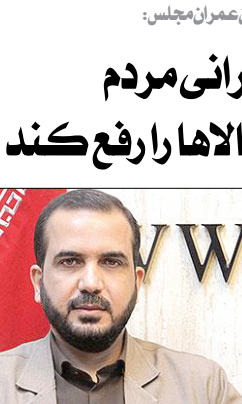
عضو کمیسیون عمران مجلس گفت:

انتظار است کالاهای اساسی طبق قانون مجلس با قیمت شهر یور یوم سال ۱۴۰۰ عرضه شوند یا حداقل قیمت‌ها پیش از این افزایش نداشته باشند و دولت نگرانی مردم و نمایندگان آن‌ها را بابت گرانی این کالاها رفع کند.