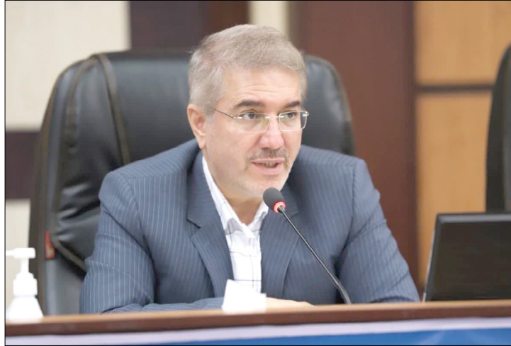
شمشین جلسه کارگروه سامانه مودیان، تأکید کرد: با توجه به نسبت به ثبت صورت‌حساب الکترونیکی در سامانه مودیان به نام خریدار، نسبت به ثبت صورت‌حساب در کارپوشه خود مطلع شوند

رئیس کل سازمان امور مالیاتی کشور بر صیانت از حقوق مودیان در اجرای قانون پایانه‌های فروشگاه‌ها و سامانه مودیان تأکید کرد. معاون وزیر اقتصاد با تأکید بر ضرورت صیانت از حقوق مودیان در اجرای قانون پایانه‌های فروشگاه‌ها و سامانه مودیان، افزود: لایحه اصلاح این قانون را به مجلس محترم شورای اسلامی ارائه دادیم تا مجوز اجرای مرحله‌ای قانون پایانه‌های فروشگاه‌ها را با رویکرد حفظ حقوق مودیان اخذ کنیم. رئیس کل سازمان امور مالیاتی کشور با اشاره به جرایم پیش‌بینی شده طبق قانون پایانه‌های فروشگاه‌ها در خصوص عدم صدور صورت‌حساب الکترونیکی توسط مودیان، اظهار داشت: در صدد آن هستیم که امکان بخشودگی ۱۰۰ درصدی