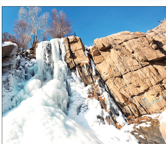
ایمان حامی خواه