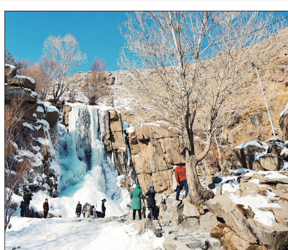
است. آبشار گنج نامه در فاصله بیست کیلومتری شهر همدان واقع شده با حدود ۱۲ متر ارتفاع یکی از زیباترین