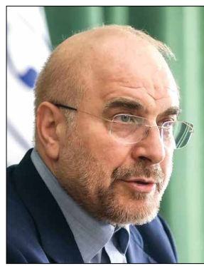
فرا رسیدن نوروز باستانی و ماه پربرکت رمضان را تبریک می گوئیم