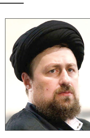
شهادت حضرت امام حسن عسکری (ع) را تسلیت می‌گوییم