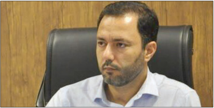
مدیر شیلات و امور آبزیان سازمان جهاد کشاورزی آذربایجان شرقی خیرداد: