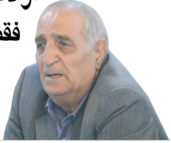
چگینی، عضو هیات رییسه انجمن تولیدکنندگان پوشاک ایران.