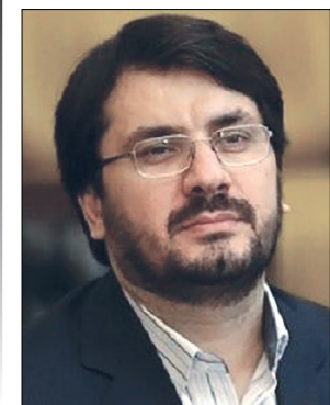
ولادت حضرت زینب (ع) و روز پرستار و بهوز را تبریک می گویم

وزیر راه و شهرسازی گفته ایران و ترکمنستان با زیرگن مهم کریدورهای شمال-جنوب و شرق-غرب هستند و دو کشور توافق کرده اند در توسعه کریدورها باهم همکاری کنند. مراد بندرپاش در مراسم افتتاحیه همایش اقتصادی تجار و بازرگانان که صبح دپویر شنبه ۲۷ آبان ماه در حاشیه پنزدهمین نمایشگاه ایران پروژه در عشق آباد پایتخت ترکمنستان برگزار شد، از شکوفایی روابط تجاری میان ایران و ترکمنستان خبر داد و گفته کشایش ها میان روابط بازرگانی دو کشور با عزم و اراده و رویکرد هوشمندانه و آینده میان مسئولان دولتی و فعالان بخش خصوصی و شرکتهای توانمند میان طرفین در حال تحقق است.