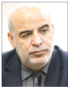
وب گاه امروز: WWW.TODAYONLINE.IR