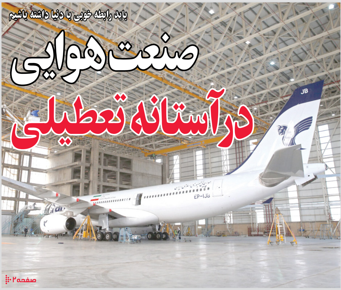
بناگاه راننده خونی با دنیا داشته باشیم