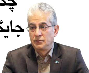
قانون جوانی جمعیت شکست خورد؟