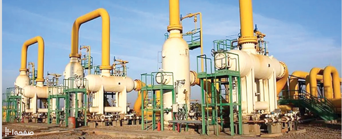
توسعه اوراسیا یا راه اندازی خط راست-کاسپین