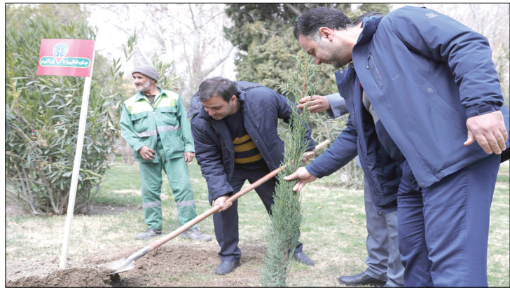
سبز از جمله باغ شاهی، پارک سوهان و پارک بر تو در استانه کهن گیلانی است و در سال آینده شاهد اجرای این پروژه ها خواهیم بود