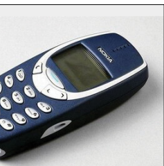
با وجود همه این اتفاقات با بررسی‌ها پاره‌ها دیده جدیدی