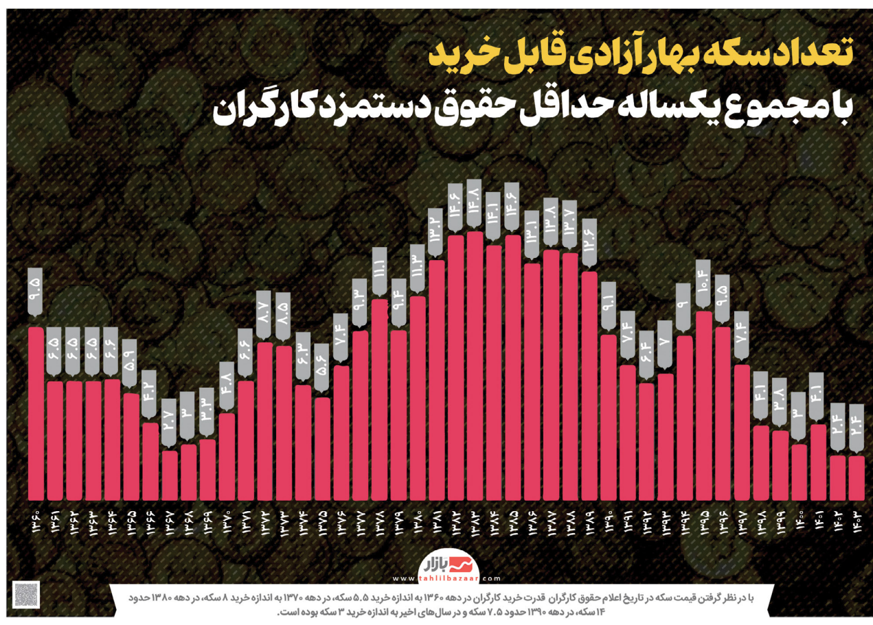
با نظر در گرفتن قیمت مسکه در تاریخ حقوق کارگران قدرت خرید کارگران در دهه ۱۳۹۰ به اندازه حدود ۵٫۵ سکه، در دهه ۱۳۸۰ به اندازه حدود ۸ سکه، در دهه ۱۳۷۰ به اندازه حدود ۲۰ سکه، در دهه ۱۳۶۰ به اندازه حدود ۳۰ سکه، در دهه ۱۳۵۰ به اندازه حدود ۴۰ سکه، در دهه ۱۳۴۰ به اندازه حدود ۵۰ سکه، در دهه ۱۳۳۰ به اندازه حدود ۶۰ سکه، در دهه ۱۳۲۰ به اندازه حدود ۷۰ سکه، در دهه ۱۳۱۰ به اندازه حدود ۸۰ سکه، در دهه ۱۳۰۰ به اندازه حدود ۹۰ سکه، در دهه ۱۲۹۰ به اندازه حدود ۱۰۰ سکه، در دهه ۱۲۸۰ به اندازه حدود ۱۱۰ سکه، در دهه ۱۲۷۰ به اندازه حدود ۱۲۰ سکه، در دهه ۱۲۶۰ به اندازه حدود ۱۳۰ سکه، در دهه ۱۲۵۰ به اندازه حدود ۱۴۰ سکه، در دهه ۱۲۴۰ به اندازه حدود ۱۵۰ سکه، در دهه ۱۲۳۰ به اندازه حدود ۱۶۰ سکه، در دهه ۱۲۲۰ به اندازه حدود ۱۷۰ سکه، در دهه ۱۲۱۰ به اندازه حدود ۱۸۰ سکه، در دهه ۱۲۰۰ به اندازه حدود ۱۹۰ سکه، در دهه ۱۱۹۰ به اندازه حدود ۲۰۰ سکه، در دهه ۱۱۸۰ به اندازه حدود ۲۱۰ سکه، در دهه ۱۱۷۰ به اندازه حدود ۲۲۰ سکه، در دهه ۱۱۶۰ به اندازه حدود ۲۳۰ سکه، در دهه ۱۱۵۰ به اندازه حدود ۲۴۰ سکه، در دهه ۱۱۴۰ به اندازه حدود ۲۵۰ سکه، در دهه ۱۱۳۰ به اندازه حدود ۲۶۰ سکه، در دهه ۱۱۲۰ به اندازه حدود ۲۷۰ سکه، در دهه ۱۱۱۰ به اندازه حدود ۲۸۰ سکه، در دهه ۱۱۰۰ به اندازه حدود ۲۹۰ سکه، در دهه ۱۰۹۰ به اندازه حدود ۳۰۰ سکه، در دهه ۱۰۸۰ به اندازه حدود ۳۱۰ سکه، در دهه ۱۰۷۰ به اندازه حدود ۳۲۰ سکه، در دهه ۱۰۶۰ به اندازه حدود ۳۳۰ سکه، در دهه ۱۰۵۰ به اندازه حدود ۳۴۰ سکه، در دهه ۱۰۴۰ به اندازه حدود ۳۵۰ سکه، در دهه ۱۰۳۰ به اندازه حدود ۳۶۰ سکه، در دهه ۱۰۲۰ به اندازه حدود ۳۷۰ سکه، در دهه ۱۰۱۰ به اندازه حدود ۳۸۰ سکه، در دهه ۱۰۰۰ به اندازه حدود ۳۹۰ سکه، در دهه ۹۹۰ به اندازه حدود ۴۰۰ سکه، در دهه ۹۸۰ به اندازه حدود ۴۱۰ سکه، در دهه ۹۷۰ به اندازه حدود ۴۲۰ سکه، در دهه ۹۶۰ به اندازه حدود ۴۳۰ سکه، در دهه ۹۵۰ به اندازه حدود ۴۴۰ سکه، در دهه ۹۴۰ به اندازه حدود ۴۵۰ سکه، در دهه ۹۳۰ به اندازه حدود ۴۶۰ سکه، در دهه ۹۲۰ به اندازه حدود ۴۷۰ سکه، در دهه ۹۱۰ به اندازه حدود ۴۸۰ سکه، در دهه ۹۰۰ به اندازه حدود ۴۹۰ سکه، در دهه ۸۹۰ به اندازه حدود ۵۰۰ سکه، در دهه ۸۸۰ به اندازه حدود ۵۱۰ سکه، در دهه ۸۷۰ به اندازه حدود ۵۲۰ سکه، در دهه ۸۶۰ به اندازه حدود ۵۳۰ سکه، در دهه ۸۵۰ به اندازه حدود ۵۴۰ سکه، در دهه ۸۴۰ به اندازه حدود ۵۵۰ سکه، در دهه ۸۳۰ به اندازه حدود ۵۶۰ سکه، در دهه ۸۲۰ به اندازه حدود ۵۷۰ سکه، در دهه ۸۱۰ به اندازه حدود ۵۸۰ سکه، در دهه ۸۰۰ به اندازه حدود ۵۹۰ سکه، در دهه ۷۹۰ به اندازه حدود ۶۰۰ سکه، در دهه ۷۸۰ به اندازه حدود ۶۱۰ سکه، در دهه ۷۷۰ به اندازه حدود ۶۲۰ سکه، در دهه ۷۶۰ به اندازه حدود ۶۳۰ سکه، در دهه ۷۵۰ به اندازه حدود ۶۴۰ سکه، در دهه ۷۴۰ به اندازه حدود ۶۵۰ سکه، در دهه ۷۳۰ به اندازه حدود ۶۶۰ سکه، در دهه ۷۲۰ به اندازه حدود ۶۷۰ سکه، در دهه ۷۱۰ به اندازه حدود ۶۸۰ سکه، در دهه ۷۰۰ به اندازه حدود ۶۹۰ سکه، در دهه ۶۹۰ به اندازه حدود ۷۰۰ سکه، در دهه ۶۸۰ به اندازه حدود ۷۱۰ سکه، در دهه ۶۷۰ به اندازه حدود ۷۲۰ سکه، در دهه ۶۶۰ به اندازه حدود ۷۳۰ سکه، در دهه ۶۵۰ به اندازه حدود ۷۴۰ سکه، در دهه ۶۴۰ به اندازه حدود ۷۵۰ سکه، در دهه ۶۳۰ به اندازه حدود ۷۶۰ سکه، در دهه ۶۲۰ به اندازه حدود ۷۷۰ سکه، در دهه ۶۱۰ به اندازه حدود ۷۸۰ سکه، در دهه ۶۰۰ به اندازه حدود ۷۹۰ سکه، در دهه ۵۹۰ به اندازه حدود ۸۰۰ سکه، در دهه ۵۸۰ به اندازه حدود ۸۱۰ سکه، در دهه ۵۷۰ به اندازه حدود ۸۲۰ سکه، در دهه ۵۶۰ به اندازه حدود ۸۳۰ سکه، در دهه ۵۵۰ به اندازه حدود ۸۴۰ سکه، در دهه ۵۴۰ به اندازه حدود ۸۵۰ سکه، در دهه ۵۳۰ به اندازه حدود ۸۶۰ سکه، در دهه ۵۲۰ به اندازه حدود ۸۷۰ سکه، در دهه ۵۱۰ به اندازه حدود ۸۸۰ سکه، در دهه ۵۰۰ به اندازه حدود ۸۹۰ سکه، در دهه ۴۹۰ به اندازه حدود ۹۰۰ سکه، در دهه ۴۸۰ به اندازه حدود ۹۱۰ سکه، در دهه ۴۷۰ به اندازه حدود ۹۲۰ سکه، در دهه ۴۶۰ به اندازه حدود ۹۳۰ سکه، در دهه ۴۵۰ به اندازه حدود ۹۴۰ سکه، در دهه ۴۴۰ به اندازه حدود ۹۵۰ سکه، در دهه ۴۳۰ به اندازه حدود ۹۶۰ سکه، در دهه ۴۲۰ به اندازه حدود ۹۷۰ سکه، در دهه ۴۱۰ به اندازه حدود ۹۸۰ سکه، در دهه ۴۰۰ به اندازه حدود ۹۹۰ سکه، در دهه ۳۹۰ به اندازه حدود ۱۰۰۰ سکه، در دهه ۳۸۰ به اندازه حدود ۱۰۱۰ سکه، در دهه ۳۷۰ به اندازه حدود ۱۰۲۰ سکه، در دهه ۳۶۰ به اندازه حدود ۱۰۳۰ سکه، در دهه ۳۵۰ به اندازه حدود ۱۰۴۰ سکه، در دهه ۳۴۰ به اندازه حدود ۱۰۵۰ سکه، در دهه ۳۳۰ به اندازه حدود ۱۰۶۰ سکه، در دهه ۳۲۰ به اندازه حدود ۱۰۷۰ سکه، در دهه ۳۱۰ به اندازه حدود ۱۰۸۰ سکه، در دهه ۳۰۰ به اندازه حدود ۱۰۹۰ سکه، در دهه ۲۹۰ به اندازه حدود ۱۱۰۰ سکه، در دهه ۲۸۰ به اندازه حدود ۱۱۱۰ سکه، در دهه ۲۷۰ به اندازه حدود ۱۱۲۰ سکه، در دهه ۲۶۰ به اندازه حدود ۱۱۳۰ سکه، در دهه ۲۵۰ به اندازه حدود ۱۱۴۰ سکه، در دهه ۲۴۰ به اندازه حدود ۱۱۵۰ سکه، در دهه ۲۳۰ به اندازه حدود ۱۱۶۰ سکه، در دهه ۲۲۰ به اندازه حدود ۱۱۷۰ سکه، در دهه ۲۱۰ به اندازه حدود ۱۱۸۰ سکه، در دهه ۲۰۰ به اندازه حدود ۱۱۹۰ سکه، در دهه ۱۹۰ به اندازه حدود ۱۲۰۰ سکه، در دهه ۱۸۰ به اندازه حدود ۱۲۱۰ سکه، در دهه ۱۷۰ به اندازه حدود ۱۲۲۰ سکه، در دهه ۱۶۰ به اندازه حدود ۱۲۳۰ سکه، در دهه ۱۵۰ به اندازه حدود ۱۲۴۰ سکه، در دهه ۱۴۰ به اندازه حدود ۱۲۵۰ سکه، در دهه ۱۳۰ به اندازه حدود ۱۲۶۰ سکه، در دهه ۱۲۰ به اندازه حدود ۱۲۷۰ سکه، در دهه ۱۱۰ به اندازه حدود ۱۲۸۰ سکه، در دهه ۱۰۰ به اندازه حدود ۱۲۹۰ سکه، در دهه ۹۹۰ به اندازه حدود ۱۳۰۰ سکه، در دهه ۹۸۰ به اندازه حدود ۱۳۱۰ سکه، در دهه ۹۷۰ به اندازه حدود ۱۳۲۰ سکه، در دهه ۹۶۰ به اندازه حدود ۱۳۳۰ سکه، در دهه ۹۵۰ به اندازه حدود ۱۳۴۰ سکه، در دهه ۹۴۰ به اندازه حدود ۱۳۵۰ سکه، در دهه ۹۳۰ به اندازه حدود ۱۳۶۰ سکه، در دهه ۹۲۰ به اندازه حدود ۱۳۷۰ سکه، در دهه ۹۱۰ به اندازه حدود ۱۳۸۰ سکه، در دهه ۹۰۰ به اندازه حدود ۱۳۹۰ سکه، در دهه ۸۹۰ به اندازه حدود ۱۴۰۰ سکه، در دهه ۸۸۰ به اندازه حدود ۱۴۱۰ سکه، در دهه ۸۷۰ به اندازه حدود ۱۴۲۰ سکه، در دهه ۸۶۰ به اندازه حدود ۱۴۳۰ سکه، در دهه ۸۵۰ به اندازه حدود ۱۴۴۰ سکه، در دهه ۸۴۰ به اندازه حدود ۱۴۵۰ سکه، در دهه ۸۳۰ به اندازه حدود ۱۴۶۰ سکه، در دهه ۸۲۰ به اندازه حدود ۱۴۷۰ سکه، در دهه ۸۱۰ به اندازه حدود ۱۴۸۰ سکه، در دهه ۸۰۰ به اندازه حدود ۱۴۹۰ سکه، در دهه ۷۹۰ به اندازه حدود ۱۵۰۰ سکه، در دهه ۷۸۰ به اندازه حدود ۱۵۱۰ سکه، در دهه ۷۷۰ به اندازه حدود ۱۵۲۰ سکه، در دهه ۷۶۰ به اندازه حدود ۱۵۳۰ سکه، در دهه ۷۵۰ به اندازه حدود ۱۵۴۰ سکه، در دهه ۷۴۰ به اندازه حدود ۱۵۵۰ سکه، در دهه ۷۳۰ به اندازه حدود ۱۵۶۰ سکه، در دهه ۷۲۰ به اندازه حدود ۱۵۷۰ سکه، در دهه ۷۱۰ به اندازه حدود ۱۵۸۰ سکه، در دهه ۷۰۰ به اندازه حدود ۱۵۹۰ سکه، در دهه ۶۹۰ به اندازه حدود ۱۶۰۰ سکه، در دهه ۶۸۰ به اندازه حدود ۱۶۱۰ سکه، در دهه ۶۷۰ به اندازه حدود ۱۶۲۰ سکه، در دهه ۶۶۰ به اندازه حدود ۱۶۳۰ سکه، در دهه ۶۵۰ به اندازه حدود ۱۶۴۰ سکه، در دهه ۶۴۰ به اندازه حدود ۱۶۵۰ سکه، در دهه ۶۳۰ به اندازه حدود ۱۶۶۰ سکه، در دهه ۶۲۰ به اندازه حدود ۱۶۷۰ سکه، در دهه ۶۱۰ به اندازه حدود ۱۶۸۰ سکه، در دهه ۶۰۰ به اندازه حدود ۱۶۹۰ سکه، در دهه ۵۹۰ به اندازه حدود ۱۷۰۰ سکه، در دهه ۵۸۰ به اندازه حدود ۱۷۱۰ سکه، در دهه ۵۷۰ به اندازه حدود ۱۷۲۰ سکه، در دهه ۵۶۰ به اندازه حدود ۱۷۳۰ سکه، در دهه ۵۵۰ به اندازه حدود ۱۷۴۰ سکه، در دهه ۵۴۰ به اندازه حدود ۱۷۵۰ سکه، در دهه ۵۳۰ به اندازه حدود ۱۷۶۰ سکه، در دهه ۵۲۰ به اندازه حدود ۱۷۷۰ سکه، در دهه ۵۱۰ به اندازه حدود ۱۷۸۰ سکه، در دهه ۵۰۰ به اندازه حدود ۱۷۹۰ سکه، در دهه ۴۹۰ به اندازه حدود ۱۸۰۰ سکه، در دهه ۴۸۰ به اندازه حدود ۱۸۱۰ سکه، در دهه ۴۷۰ به اندازه حدود ۱۸۲۰ سکه، در دهه ۴۶۰ به اندازه حدود ۱۸۳۰ سکه، در دهه ۴۵۰ به اندازه حدود ۱۸۴۰ سکه، در دهه ۴۴۰ به اندازه حدود ۱۸۵۰ سکه، در دهه ۴۳۰ به اندازه حدود ۱۸۶۰ سکه، در دهه ۴۲۰ به اندازه حدود ۱۸۷۰ سکه، در دهه ۴۱۰ به اندازه حدود ۱۸۸۰ سکه، در دهه ۴۰۰ به اندازه حدود ۱۸۹۰ سکه، در دهه ۳۹۰ به اندازه حدود ۱۹۰۰ سکه، در دهه ۳۸۰ به اندازه حدود ۱۹۱۰ سکه