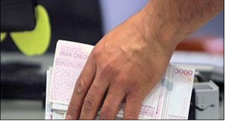
مدیرکل بیمه‌های ایران؛