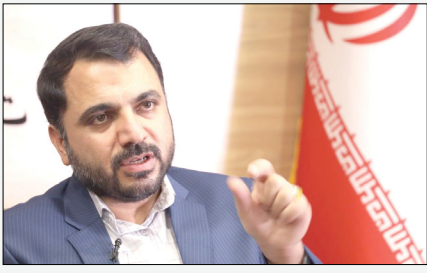
قرار گرفته اند از دیگر خواسته های زارع پور از مدیران حاضر در جلسه بود. زارع پور با اشاره به برخی آسیب‌های اجتماعی فضای مجازی گفت: باید اقدامات ارزنده‌ای که در سالهای گذشته برای توسعه ارتباطات روستایی صورت گرفته است، تداوم کرد. بر اساس برنامه ریزی صورت گرفته، دسترسی باقیمانده روستاهای بالای ۲۰ خانوار تا پایان سال ۱۴۰۱ تکمیل می‌شود. وی تصریح کرد که روستاهای باقی مانده به لحاظ صعب العبور و کوهستانی بودن جزو سخت ترین بخش باقی مانده از این طرح ملی بوده و نیازمند کار مجاهدانه هستند. وزیر ارتباطات و فناوری اطلاعات همچنین بر استفاده از ظرفیت گروه‌های جهادی برای توسعه ارتباطات در مناطق دور افتاده و محروم تاکید کرد. وی افزود: تا کار گروهی مشکل از مدیران اپراتورها و مدیران عامل مخابرات ایران و وزیران ارتباطات و سایر دستگاه‌ها حل مشکلات و سرعت بخشیدن به روند توسعه دسترسی روستاهای به شبکه ملی اطلاعات تشکیل و موضوع با جدیت پیگیری شود. ضرورت افزایش کیفیت ارتباطات در روستاهایی که تاکنون پوشش نرسیده است، در دستور کار قرار خواهد گرفت.

اتصالات روستایی و اپراتورهای ثابت و سیار با تاکید بر سرعت بخشیدن به ایجاد دسترسی تمام روستاهای به شبکه ملی اطلاعات؛ از اتصال تمام روستاهای بالای ۲۰ خانوار به ارتباطات تا پایان سال ۱۴۰۱ خبر داد.