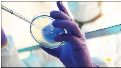
محققان در حال بررسی نمونه‌های غذایی در آزمایشگاه.

به حمایت ستاد توسعه زیست فناوری معاونت علمی و فناوری ریاست جمهوری است.