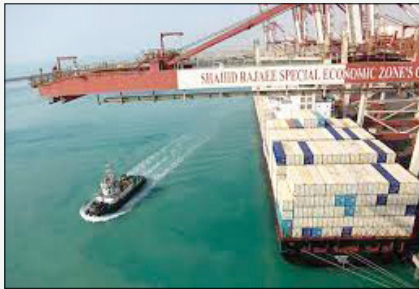
مدیر کل دفتر توسعه خدمات بازرگانی سازمان توسعه و تجارت گفت: در آینده‌ای نزدیک خطوط منظم دریایی به ۱۰ خط افزایش می‌یابد که به رشد مبادلات تجاری ایران با کشورهای حوزه دریایی خزر کمک می‌کند.

مدیر کل هماهنگی خدمات بازرگانی شرکت بازرگانی دولتی ایران اظهار داشت: این کالاها شامل انواع برنج، گندم، شکر